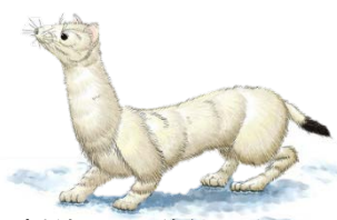
(挿絵: 平田美紗子作)