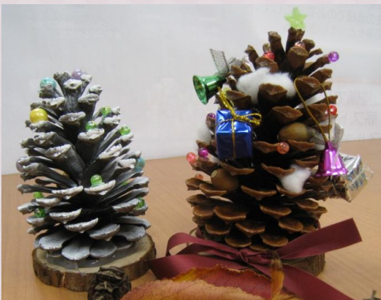
例)まつぼっくりツリー

クリスマスツリーなど、皆様のアイデアで まつぼっくりをへんしんさせてください！ まつぼっくりに付けたいものはもってきて ください！（ビーズ・リボンなど）