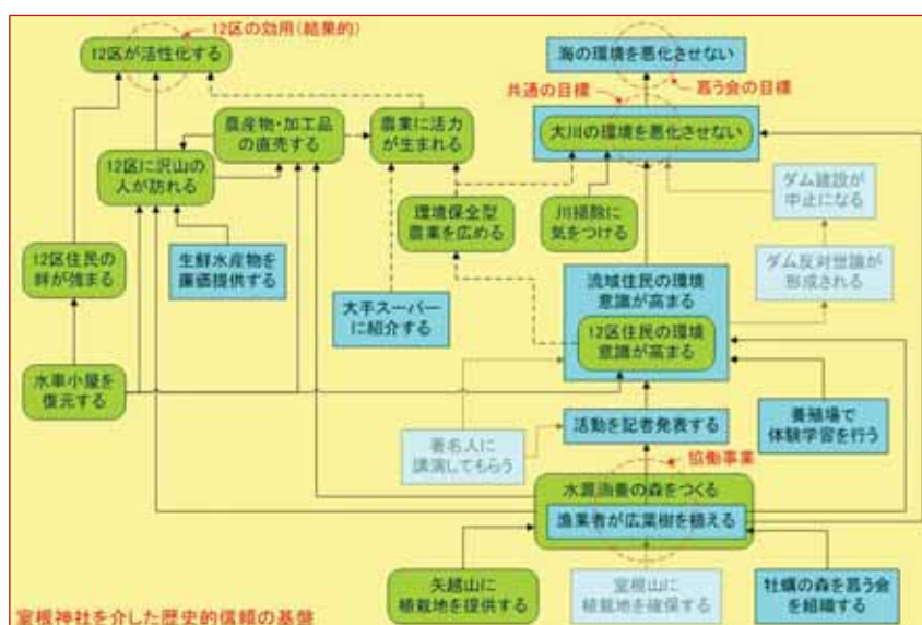
図-1 PCM 法で描いた慕う会と 12 区の連携の仕組み (2005 年時点)

今回、Win-Win の可能性を系図で検証した結果、連携の仕組みや条件が分析できました。今後、事例を増やし、連携の必要性に係わる環境変化や連携の結果生じた利益の分配に不均衡が生じたときの対応などにも着目して分析を重ねたいと思います。方法論としても、既にある連携の分析だけでなく、新しい連携の可能性を探る手法に発展させたいと考えています。