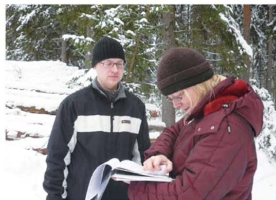
写真 フィンランド中南部の個人有林と所有者

フィンランドの 2 系統の森林所有者共同組織は、公的賦課金と市場経済の中に各々資金調達源を求めてきたこと、しかし、いずれも安定した財源ではないことが本研究から見えてきました。超長期の時間を不可分とする森林資源に対し、資本制社会の中で安定的に資金を調達しつつ、如何に適切な森林管理を続けていくか。この難問に答えるため、諸外国の実態の中に、日本の森林管理の将来像をこれからも探っていきたいと思います。