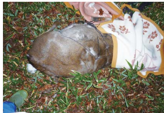
図2 ドロップネットで捕獲されたシカ。落ち着かせるため頭部（右側）に毛布をかけている