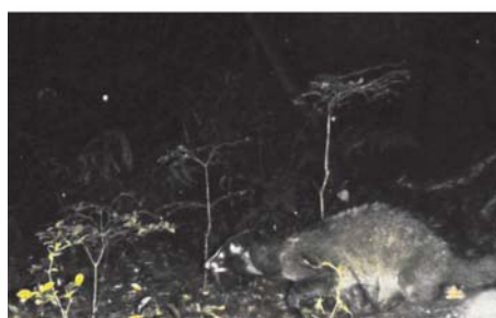
写真3 こちらも移入種のハクビシン