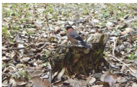
写真1 サクラの花芽が膨らむ頃に訪れるウン

構内で撮影された鳥獣の写真は、関西支所の森の展示館でも見ることができます。興味のある方は一度ご覧ください。