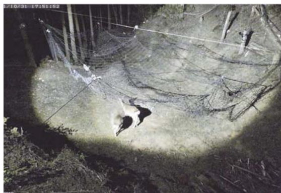
図1 立木を利用し、作業道に設置されたドロップネットの下に誘引されたシカ。ウェブカメラと無線LANで遠隔的に監視

森林用ドロップネットの開発は、京都府農林水産技術センター、京都府森林保全課、南丹市猟友会との共同研究として行いました。なおドロップネットは法定猟具ではないため、狩猟ではなく許可捕獲による運用となります。また設置には土地所有者の許可が必要です。