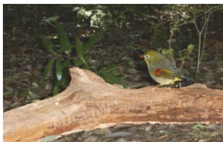
写真2 特定外来生物のソウシチョウ