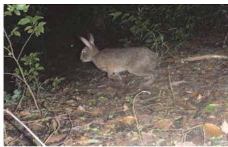
写真4 稀に撮影されるニホンノウサギ

巻頭帯写真について：関西支所落葉樹木園。開花や展葉・落葉など四季により様々な変化を観察することができます。