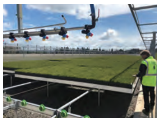
写真2 ムービングベンチ