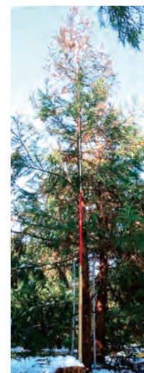
写真2 無花粉スギ品種「林育不稔2号」