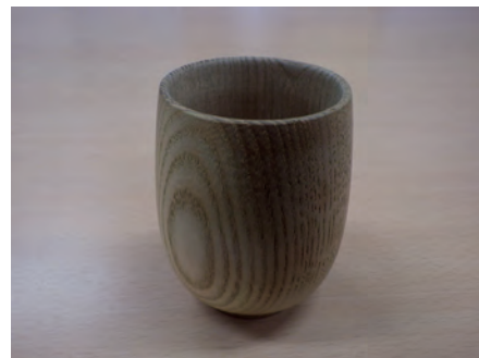
写真2 キハダ材の湯のみ茶碗

キハダは薬用以外にも用途の多い樹種です。内樹皮は鮮やかな黄色の天然染料として使われるとともに、材は美しい光沢を出し、家具や器具(写真2)などの用材になります。また、キハダは直径が1cmほどの大きさの果実を多数つけ、同じミカン科の山椒のような強い苦味を持ち、アイヌ民族では食用としていました。花は北海道で良質な蜂蜜の蜜源となっています。