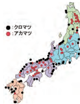
図 1 本事業で確立した培養線虫系統の採取地 凡例の色は線虫を採取した被害木の樹種を示す。

平成 25 年から 27 年にかけて日本全国のマツ材線虫病被害木 361 本から材片を収集し、新たに 186 の線虫の培養系統を作しました（図 1）。全国の育種場でこれらの線虫をマツの苗木に接種して線虫の病原力の評価を進め、従来の線虫より病原性が強い線虫の系統を見いだしました。