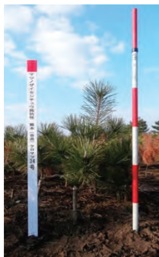
写真1 マツノザイセンチュウ抵抗性品種「熊本(合志)クロマツ34号」