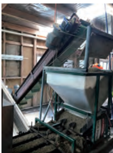
写真1 自動土詰機による覆土の様子

ここでは、NZ の主な造林樹種であるラジアータマツの苗木を生産しています。ラジアータマツは実生だけでなくさし木でも増殖されており、さし木発根性の低下を防ぐため、不定胚の凍結保存、組織培養から育成した苗の順化、採穂園の剪定および3年毎の更新等が行われていました。また、コンテナ苗の生産も行われており、自動土詰・播種機、ムービングベンチ及び自動灌水装置等を見学しました。これらの苗木は育成段階に応じて集約的に施肥や灌水等の管理が行われ、全て1年で出荷されるということです。