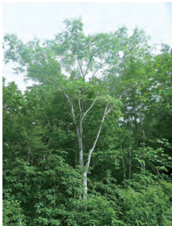
写真1 キハダ (福島県南会津町)

キハダ ( Phellodendron amurense ) は、ミカン科キハダ属の落葉高木でアジア北東部、日本では北海道から九州に分布します(写真1)。比較的成長が早い広葉樹で、20年で直径20cmを超えることもあります。鮮やかな黄色を呈する内樹皮には、抗菌・抗炎症の作用があるベルベリンが含まれます。内樹皮を乾燥させたものが生薬「オウバク」であり、胃炎や二日酔いに効果がある漢方薬に配合されています。また、長野県の「百草丸」、奈良県の「陀羅尼助丸(ダラニスケガン)」、鳥取県の「煉熊丸(ネリグマガン)」はキハダのエキスを丸く固めた丸薬であり、伝統的な民間薬として古くから使われています。これら伝統薬は山岳修験者の常備薬として愛用され、広められたとされています。