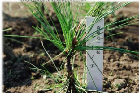
森林総研林木育種センター東北育種場生まれ 三男 イノチ 平成25年の里帰りをめざします。