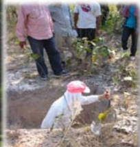
カンボジアでの土壌調査