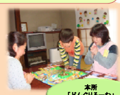
本所 「どんぐり一む」 H21 3月~