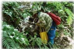
マレーシアでの菌類調査