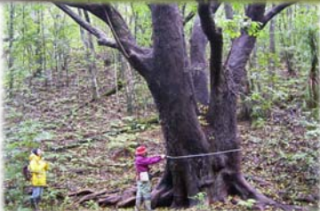
世界遺産小笠原での外来植物の調査