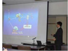
筑波大 柳澤純教授による講演会