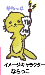
イメージキャラクター ならっこ