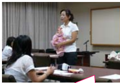
サポーター養成講座。基本講座・ ブラッシュアップ講座があります