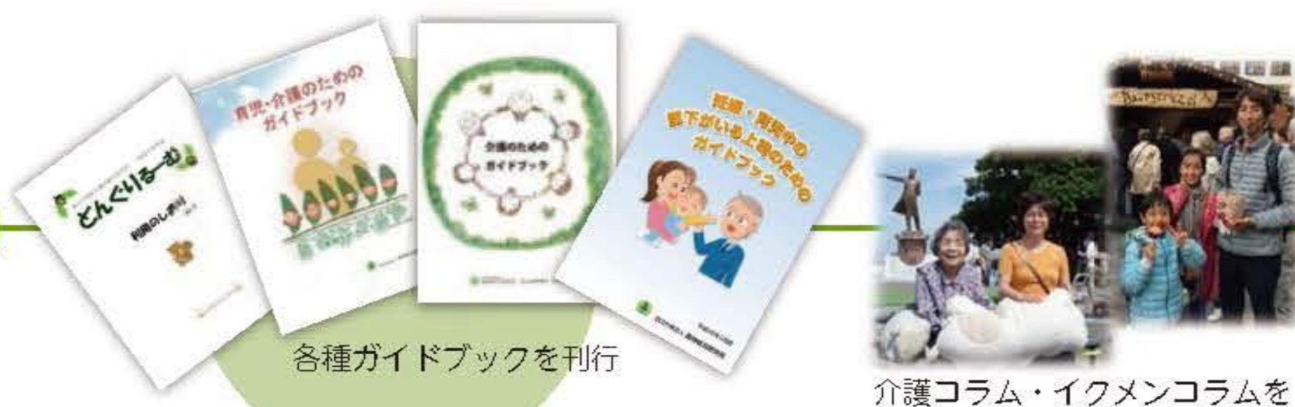
各種ガイドブックを刊行