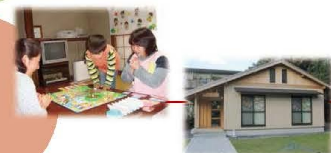
一時預り保育室（つくば、京都）