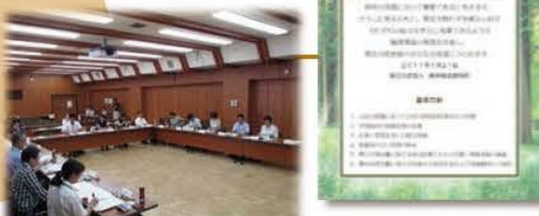
ダイバーシティ・サポート・ オフィス総会