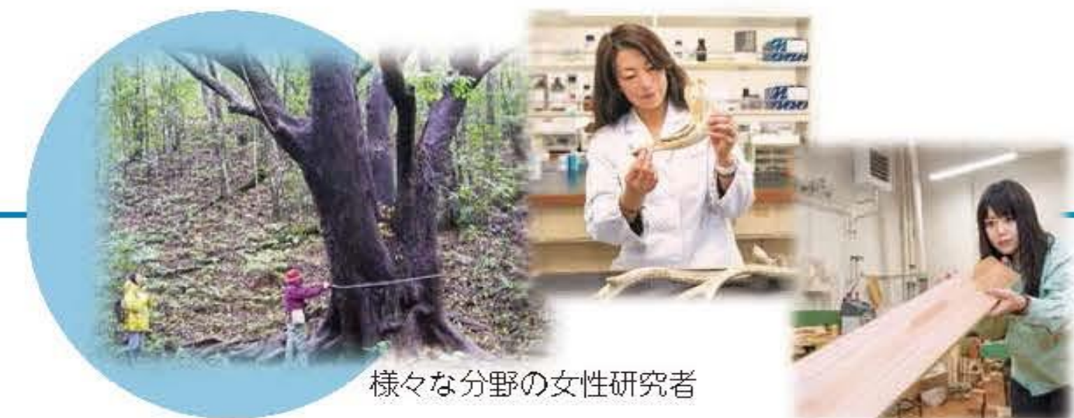
様々な分野の女性研究者