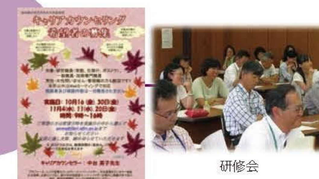
キャリアカウンセリング