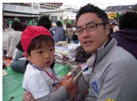
▲保育園の運動会で。かけっこでメダルをもらった長男を抱っこで祝福。

育休を取れる環境は恵まれていると言われることもあるし、自分も後ろめたい気持ちになることがあります。でも、日本も北欧のパパクォータ制のように、父親が当たり前に育休を取れるようになれば、面白い社会になるんじゃないかなと思っています。子育ては本当に面白いし、ハマりますよ。もし育休が取れなくても、親子には日々の朝夕の時間が大事だし、それをしっかり楽しめたらいいですよね。