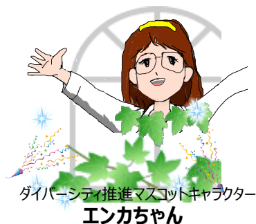
ダイバーシティ推進マスコットキャラクター エンカちゃん