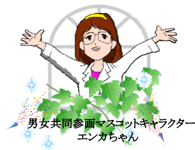
男女共同参画マスコットキャラクター エンカちゃん