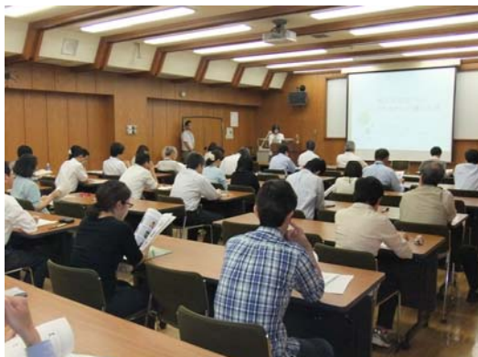
第11回エンカレッジ推進セミナーに対する評価 (参加者アンケートより)

男女共同参画に関するテーマで年2～3回セミナーを開催しています。H24年度の初回として、6月1日に介護をテーマにして第11回エンカレッジ推進セミナーを開催し、好評を得ました