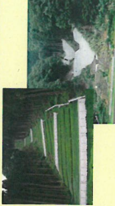
治山対策による復旧等のイメージ