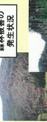
森林被害の発生状況