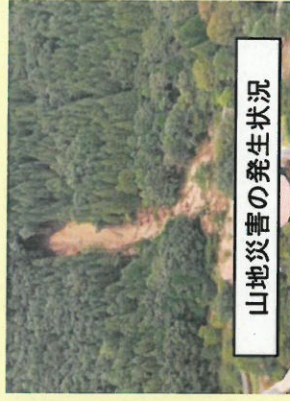
山地災害の発生状況

集中豪雨等に起因する土砂・流木の流出や崩壊、火山地域における土石流などの災害を防止するための治山対策を実施し、安全・安心を確保。