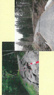
路網整備のイメージ