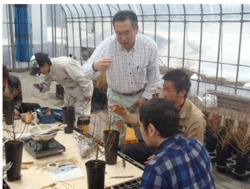
技術指導 （北海道育種場）