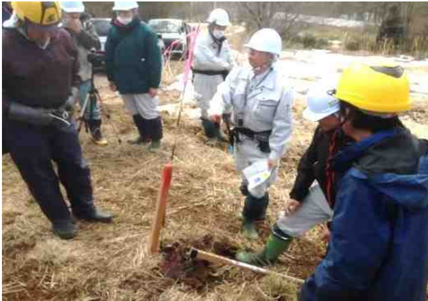
スギコンテナ苗の普及と植栽、 成長調査の実施(福島県福島市)