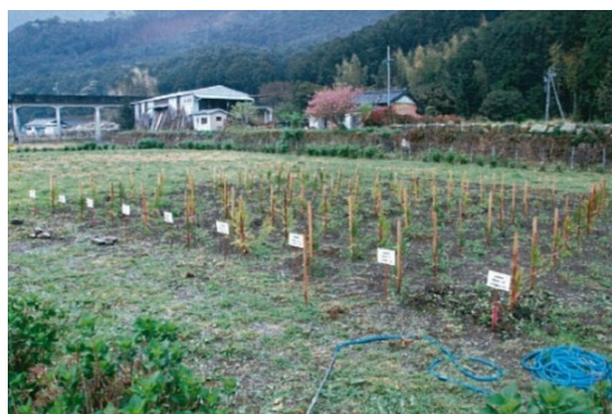
認定特定増殖事業者の採穂園 （三重県内）