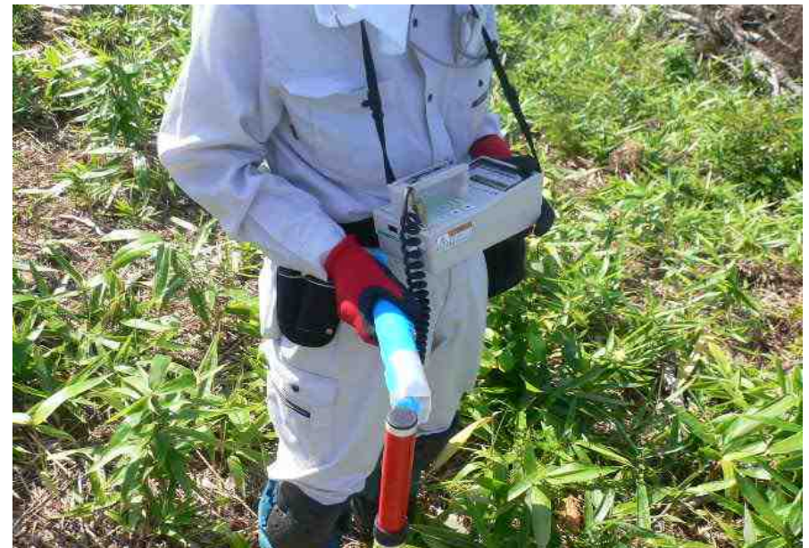
新規植栽木中の放射性物質動態調査 (福島県川内村)