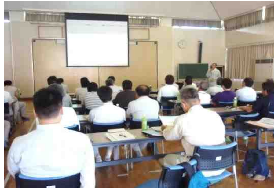
研究者による研究成果の講義及び 意見交換の実施 (九州整備局現地検討会)