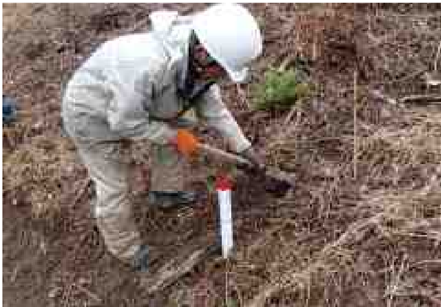
スギエリートツリーの普及と植栽 (熊本県山都町)