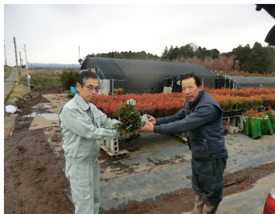
原種苗木等の配布 （九州育種場）