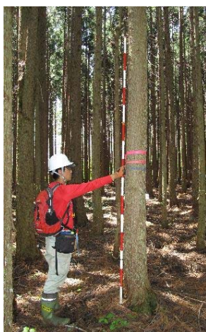
申請木（原木） （東北育種場）