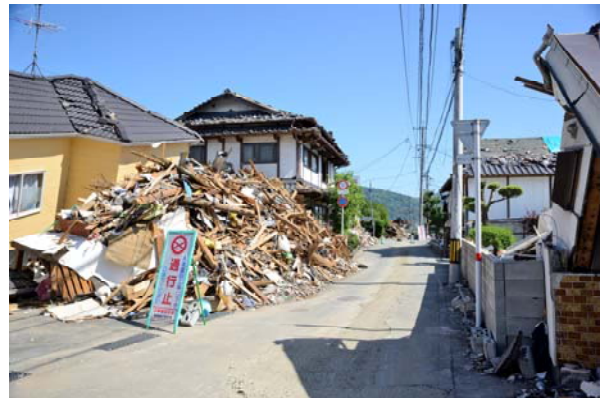
写真2 1階が層崩壊した木造2階建(益城町宮園)