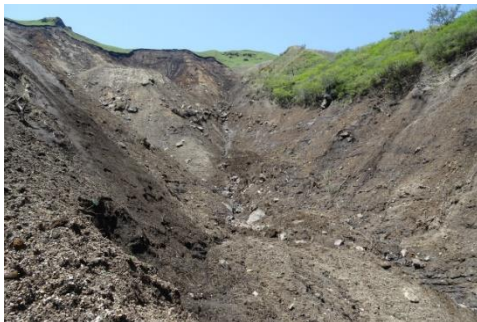
内早川地区崩壊地