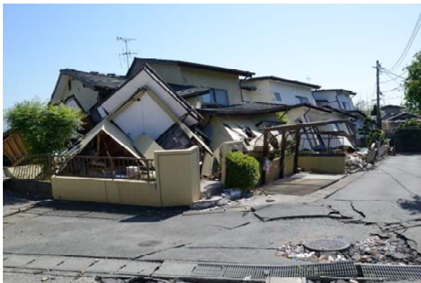
写真3 新耐震基準による木造住宅(益城町宮園)