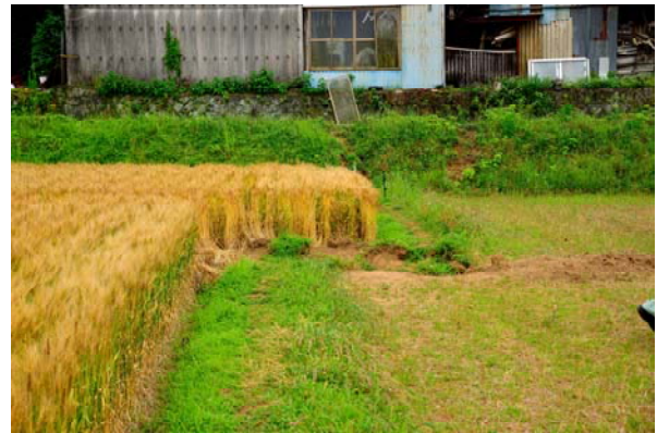
写真5 地表に現れた断層の横ずれ(益城町堂園)

益城町においては、県道28号線に沿った南北約300m×東西約2kmにわたる帯状のエリアで壊滅的な被害が発生していた。写真1の左側の建物は鉄骨造4階建て店舗兼共同住宅の2階部分が層崩壊し、3階以上が2m程度西側にずれていた。奥側に見える木造2階建て店舗の1階部分もつぶれていた。写真2は木造2階建ての1階部分がつぶれた建物の向こうに建物ごと転倒したもの、屋根瓦が落下したものなどが見られ、この地域ではほぼ全ての建物に何らかの被害が発生していた。