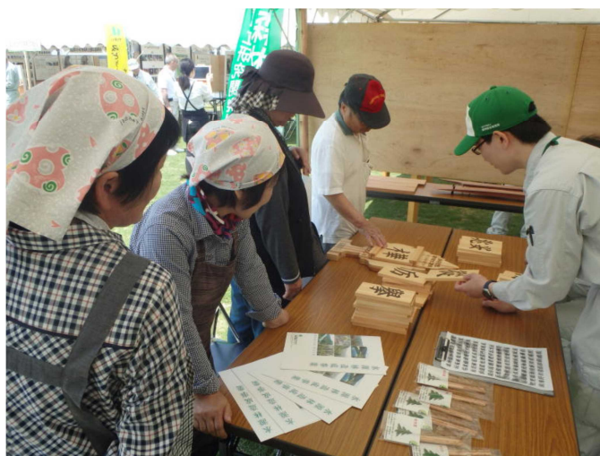
木偏の漢字当てクイズの様子