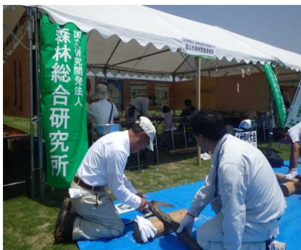
丸太切り競争の様子