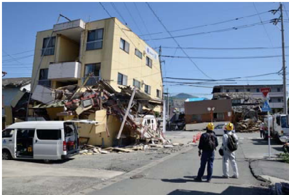
写真1 鉄骨造の店舗兼住宅(益城町木山)