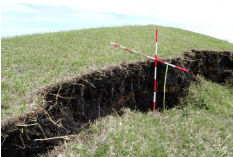
地表面の亀裂(湯浦地区)