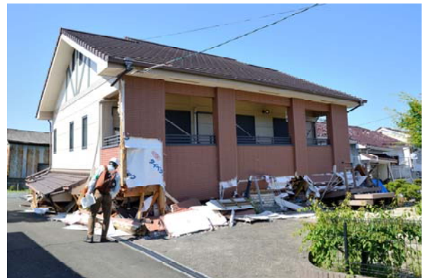
写真4 2000年以降の木造2階建住宅(益城町宮園)

益城町においては、県道28号線に沿った南北約300m×東西約2kmにわたる帯状のエリアで壊滅的な被害が発生していた。写真1の左側の建物は鉄骨造4階建て店舗兼共同住宅の2階部分が層崩壊し、3階以上が2m程度西側にずれていた。奥側に見える木造2階建て店舗の1階部分もつぶれていた。写真2は木造2階建ての1階部分がつぶれた建物の向こうに建物ごと転倒したもの、屋根瓦が落下したものなどが見られ、この地域ではほぼ全ての建物に何らかの被害が発生していた。