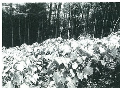
写真-3 コジイ林の皆伐後にできたアカメガシワ林 (伐採後1年目)