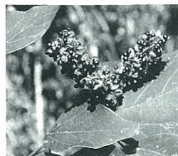
写真-1 アカメガシワの果実

果肉の油分を栄養にするためにアカメガシワの果実を好むのではないかと考えられます。