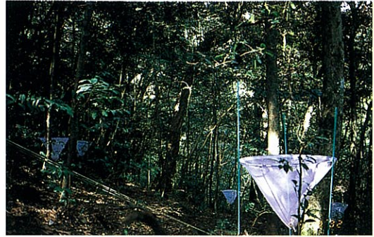
写真－1 綾試験地の林内

それではこれらの落葉量をどのようにして測定するのでしょうか。写真－1は試験地の林内の様子を写したのですが、白いロート状の容器がいくつかあります。この容器はリタートラップと呼ばれており、樹上から落下してくる物を定期的に回収することが目的です。落下物の中には落葉だけでなく、枝や花、種子、樹皮、動物の遺骸など様々な物が含まれています。こ