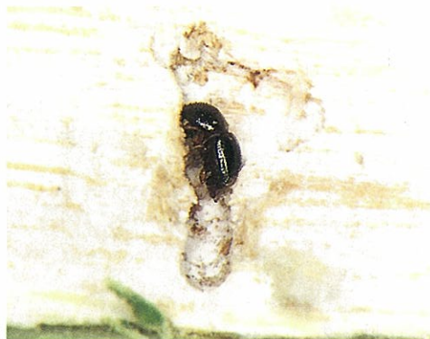
写真-1 モリシマアカシアの幹に穿入するシイノコキクイムシ成虫

孔は幹の表面から数ミリのところで広い部屋となり、その中には多い場合で20頭ほどの幼虫や蛹がひしめいています(写真-2)。オスはほんの数頭で、あとは全部メスです。この虫は同じ孔にいる兄弟姉妹間で交尾をするので、兄弟間でメスのとり合いが起こらないように母親がわざとオスを少なくしていると考えられています。