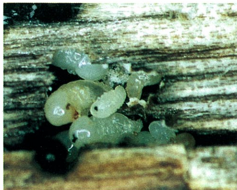
写真-2 坑道内で生育していた幼虫と蛹

モリシマアカシアはかつて筑豊や天草などに広く植林され、近年では生分解性素材の原料などとして再び注目を集めています(本誌42号参照)。モリシマアカシアの生産阻害要因として漏脂症状が知られていますが、その病原体や発生機構は明らかにされていません。そこで、モリシマアカシアの木を丹念に調べていくと、幹に小さな穿入孔が見られました。孔をあけた犯人は、シイノコキクイムシです。