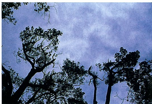
写真-2 1993年9月の台風による樹冠の破損

毎年平均7t/ha近くのリターが蓄積し続けられ、地表面のリター層はどんどん厚くなっていくはずですが、綾試験地の地表面のリター層の量を調べると8.1t/haであり、年リターフォール量より1割ほど多いだけです。このことは毎年新たに蓄積されるリターが何らかの形で消失していることを示します。この消失には、ヤスデ・トビムシなどの土壤動物や菌類などのいわゆる分解者が大きく関与しています。リターは樹木の老廃物なのですが、その中にはしっかりと栄養分が詰っています。リターに含まれる栄養分は、そのままの形で植物の根は利用できません。先の分解者の働きにより、植物が利用できる形態となった養分は土中に蓄えられていきます。この養分を植物が吸収し、自身の成長に活かして新しい葉や枝を形成してゆくのです。つまり、老廃物であったリターを、地表面で分解者の力を借りることにより、樹木自身の栄養分として再利用しているわけなのです。これは立派なリサイクルのシステムであり、我々が森林の利用を考える場合、このシステムをできるだけ損なわないようにしなければなりません。また、リターフォールを含めたリサイクル経路の研究は、近年関心の高まっている森林のCO 2 固定能力を正しく評価するためにも必要不可欠であり、今後とも継続した観測により多くの資料収集が望まれているところです。