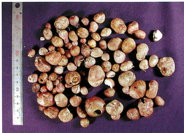
写真4 ショウロの収穫 採集直後は白いのですが、運ぶ途中にこすれあったり洗ったときの影響で赤く変色しています。胞子の採取が目的なので、虫食いのものも含んでいます。

このように、環境さえ整えてやればショウロは比較的簡単に発生するようになるきのこです。また、人工的にマツの苗にショウロの菌を定着させる技術も開発されています。効率を考えなければ、成熟して腐ったショウロを水に溶かしてまくだけでもある程度の定着が期待できます。また、海岸林近くの住民が地域総出のボランティアで腐葉土の層を取り除き、きのこの出る林を取り戻そうとする試みも行われています。