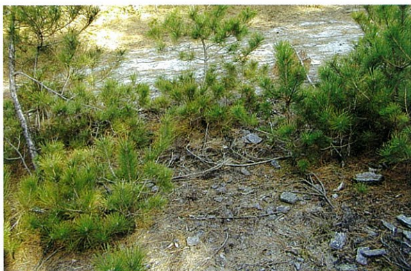
写真3 ショウロが出そうなスポット 大木が倒れた跡らしい窪みの周囲に若木が育っていました。

ショウロが発生する場所の特徴は、大雑把に言えば腐葉土の層ができていないことです。経験上若い林、あるいは新しく育った若木のそばで見られることが多いのですが、そうでなくても切り通しなどで砂が露出している場所には見られることがあります。そのため、さんざん林の中を探しても見つからなかったのに、帰りがけに工事のあとや道ばたで見つけることもよくあります。林の中では風倒木の跡で砂が掘り起こされたところに若木が更新してきているような場所がよく見つかります。