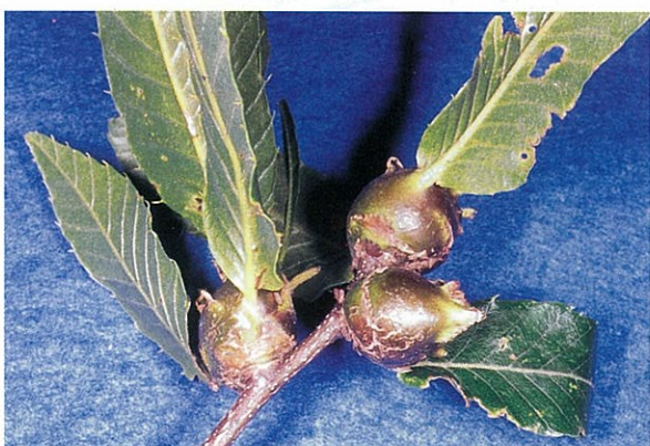
クリタマバチの虫えい

クリタマバチは雌だけで繁殖し、雄は発見されていません。成虫は体長2～3mmの小さなハチで、6～7月に虫えいに穴をあけて外に出ます。成虫はすぐに新芽に産卵し、孵化した幼虫は芽の中にもぐり込んで越冬します。翌年の4月頃から幼虫の入った芽が異常に肥大して虫えいになります。幼虫は虫えいの内部を食べながら急速に成長して、蛹から成虫になります。一つの虫えいには1匹から10匹以上の幼虫が入っています。虫えいができると、枝葉の生育や開花結実が