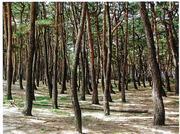
写真5 きのこ復活のために手入れをした林分 新潟県のこの林でも昭和40年代前半までは彼岸から11月上旬まで「山止め」が行われ、山止め開けに地区総出で松葉掻きを行い、燃料として平等に分配するという管理が行われていました。京都近郊の山止めとは異なり、山止め期間中もきのこの採集は自由でした。

このように、環境さえ整えてやればショウロは比較的簡単に発生するようになるきのこです。また、人工的にマツの苗にショウロの菌を定着させる技術も開発されています。効率を考えなければ、成熟して腐ったショウロを水に溶かしてまくだけでもある程度の定着が期待できます。また、海岸林近くの住民が地域総出のボランティアで腐葉土の層を取り除き、きのこの出る林を取り戻そうとする試みも行われています。