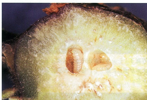
クリタマバチの虫えいの内部