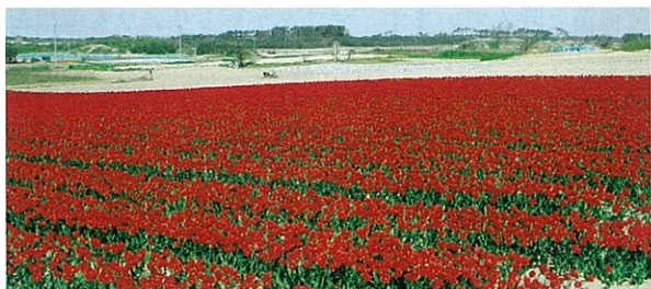
写真2 チューリップ畑

海岸の防風防砂用に植えられたマツ林でも事情は同じで、落枝落葉は燃料として利用され、林内は枯れ枝一つない状態に保たれてきました。いわゆる白砂青松です。この状態はマツの健全性を保つにもよいと考えられています。ところが、昭和30年代から40年代にかけてのいわゆる燃料革命で地方にもプロパンガスなどが普及し、柴刈りや落ち葉掻きをする人が激減しました。そのため、放置されたマツ林には藪が茂り、落ち葉が積もるようになりました。