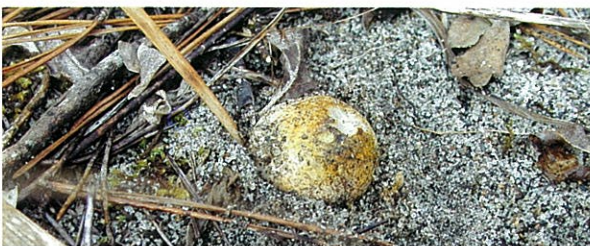
写真1 地表に顔を出したショウロ 完全に地中に埋まった状態で発生することが多いのですが、地上に顔を出すこともあります。その場合は黄褐色に変色したり、虫などに食べられたりすることが多くなります。なお、ショウロの胞子はウサギの胃腸を通過しても原形を保っています。胞子を散布する上では動物に食べられた方がいいのかも知れません。

松露（しょうろ）という風雅な名前をご存じでしょうか。九州であれば、唐津名物の松露饅頭を思い出される方もいらっしゃるかも知れません。また、餡玉を砂糖衣で包んだ茶菓子にも松露という名前のものがあります。しかし、本家本元の松露とは、（読んで字の如く松の葉に降りる露のことでありますが）きのこの一種である Rhizopogon rubescens Tul. ショウロのことです。唐津には日本三大松原の一つとして知られる「虹ノ松原」があり、松露饅頭はそこで採れたショウロにちなんで名付けられたものです。ちなみに、神奈川県藤沢市には松露羊羹というお菓子がありますが、こちらは湘南海岸のマツ林で採れるショウロを蜜漬けにして練り込んだ羊羹だそうです。