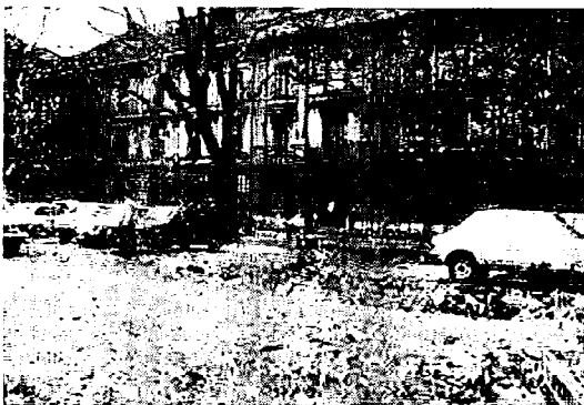
リュブリャナ大学生物工学部

ユーゴスラビアは6つの共和国と2つの自治州から構成されていますが、リュブリャナは前者の一つスロベニ