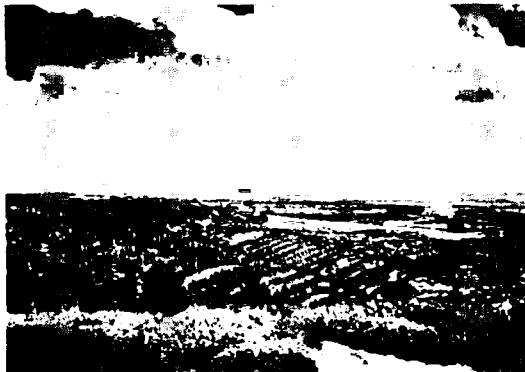
写真-1 南島アシュレイフォレストのラジアータパイン傾斜地に植栽されている。立木密度が大変疎なため、遠くからでも1本1本数えることが出来る。

研究発表の中で盛んに話題になったのが、ニュークロップとオールドクロップという表現であった。たとえば、「私はオールドクロップですから、これからはニュークロップに期待しています」というように、冗談まじりに使われたりしていた。これには若干の説明が必要であろう。