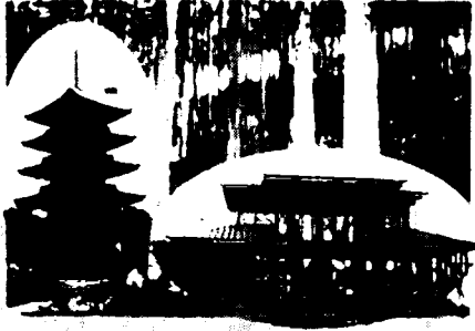
写真 2 First announcement の表紙の一部