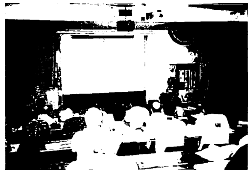
写真1 前回大会の会場の一角 (南アフリカ, ステレンボッシュ大学)

材の利用上の問題に至るまで、様々な角度から木材乾燥に関する研究と乾燥技術が議論される。今回の会議では木材乾燥のモデリング、木材と水の基礎物性、乾燥技術及び新技術開発、乾燥装置、乾燥制御システム、品質管理、住宅や二次加工における乾燥問題等がテーマとして取り上げられることになっている。