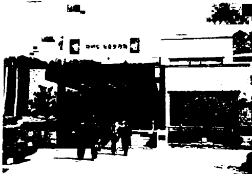
写真-1 会場のソウル大学コンベンションホール入口

午後からの一般講演では、セッション1の「持続可能な森林生態系の回復のための生態学および造林学的アプローチ」部会で12題の発表が行われた。まず、K.G. テジワニ博士による「インドにおける森林再生と生物多様性」をはじめとして、チベットやネパール、インド、タイ、マレーシア、ベトナムの各国における実際の森林再生への取り組みやその課題について報告された。また、京都大学総合地球環境学研究所中静透教授より発表され