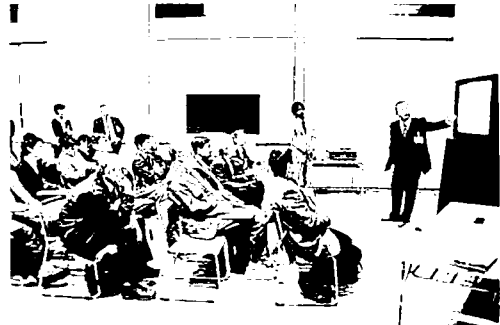
写真-6 ビデオセッション

ビデオセッションに関しては、当初登録が2件程度と少なかったが、スタディツアーに関連するものなどが加