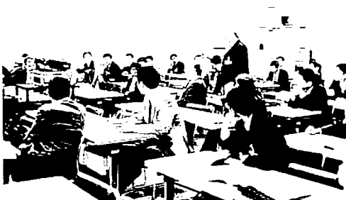
写真-5 テクニカルセミナー