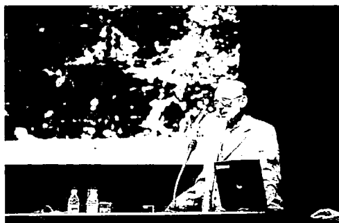
写真-3 アルベルト・ゲットレ氏による基調講演

議長にAlbert Goettle教授(ドイツ)、討論司会に山田孝氏(北海道大助教授)、発表件数3。Bhattarai氏(代表者が発表)は、ネパールにおける土砂災害情報データ