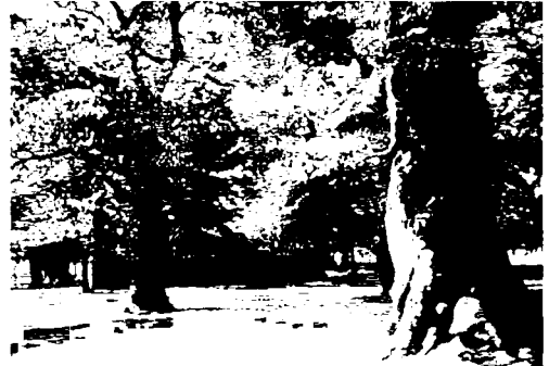
写真-5 金家由来の鶏林保護林