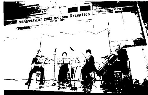
写真-8 ウェルカムパーティでの音楽演奏 (右端はウィーン農科大学ワインマイスター名誉教授)