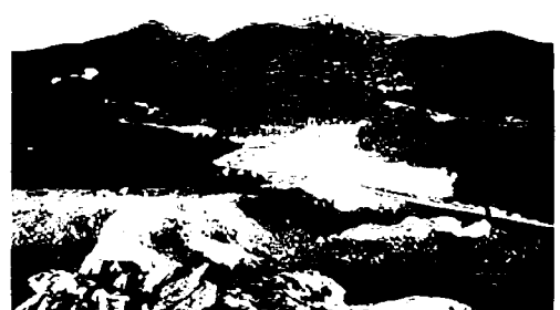
写真-6 ダンヤン地区のセメント用石灰石採取地での植林事業地