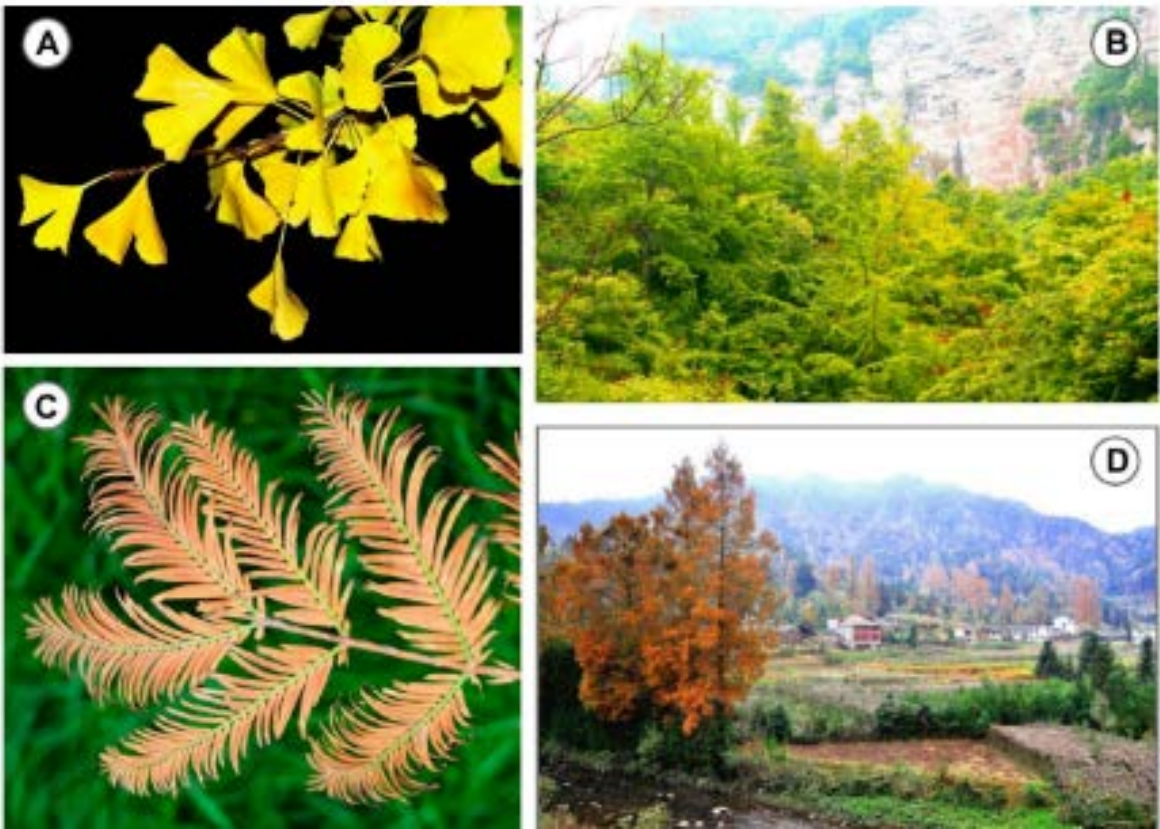
A, イチョウの葉； B, イチョウの自生地（重慶市南川区）； C, メタセコイアの葉； D, メタセコイアの自生地（湖北省利川市）。 Tang et al. (2018)より引用。