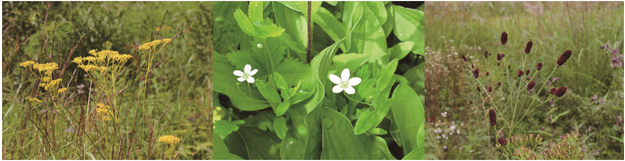
図3 写真で示したような種を指標として防鹿柵を設置することで、草原の季節的な変化や様々な色の花を保全できる可能性がある。左からオミナエシ、オオヤマフスマ、ワレモコウ