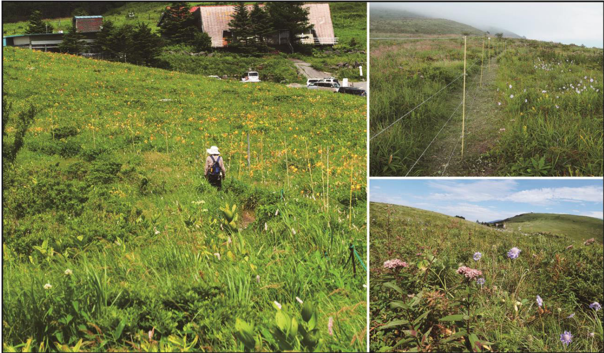
図1 霧ヶ峰高原の防鹿柵、左写真：ハイカーの右側（柵内）には保全されたニコウキスゲ（黄色花）が咲いているが、柵外（左側）にはほとんど咲いていない。右上写真：右側が柵内で左側が柵外、右下写真：霧ヶ峰車山を望む