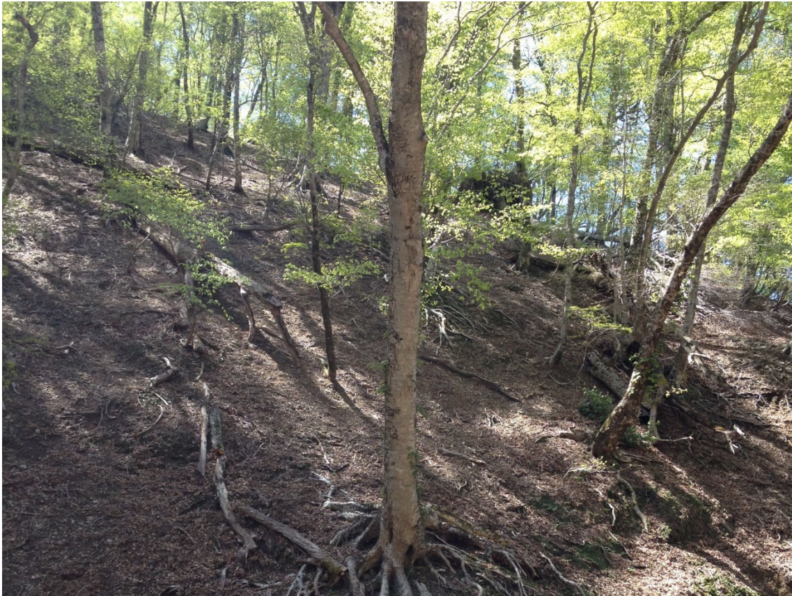
図1 芦生研究林における林床の写真。シカが好む植物はほとんど生育できていない。これと同様の現象が全国各地で起きている。