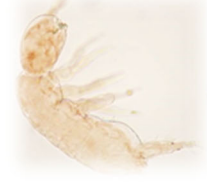
ヨシイキヌトビムシ