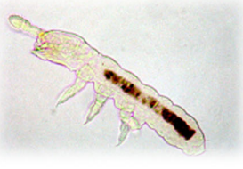
ヤマシロトビムシ