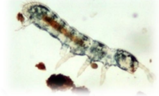
ヤツメフォルソムトビムシ