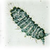
イボトビムシ亜科