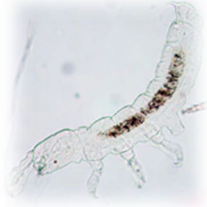
シベリアシロトビムシ