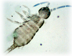
ヒメトゲトビムシ