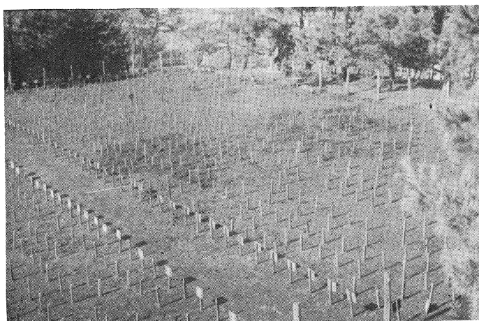
Fig. 3 浅川実験林苗畑内杭試験地