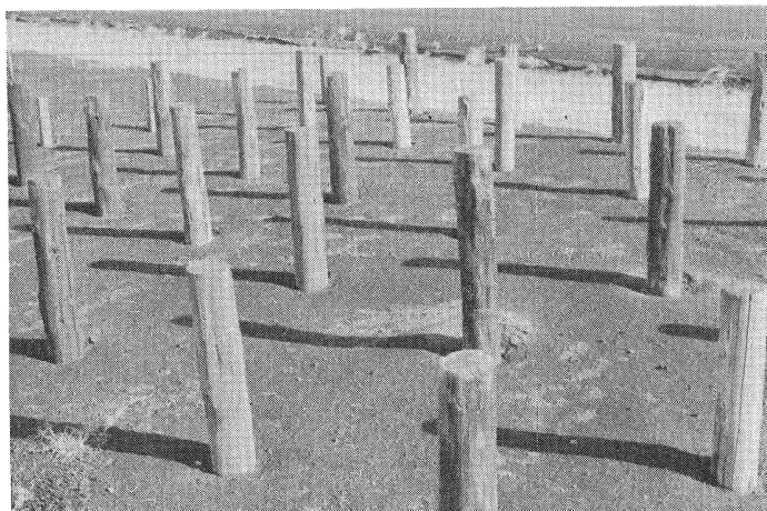
Fig. 1 加圧処理したスギ小丸太の設置状況（7号ばくろ試験地）

Partial scope of the field test site of the pressure treated SUGI logs at TSUKUBA.