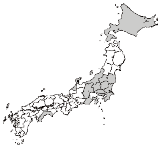
Fig. 1 データベースに情報登録された試験地が所在する都道県(灰色)

コンテナ苗植栽試験地データベースは、リレーショナルデータベースサーバとして PostgreSQL 9.5 を用いて、森林総合研究所内に設置した Linux サーバ上で運用されている。PostgreSQL には、GIS 情報のためのアドオンとして、PostGIS を追加している。現在のと