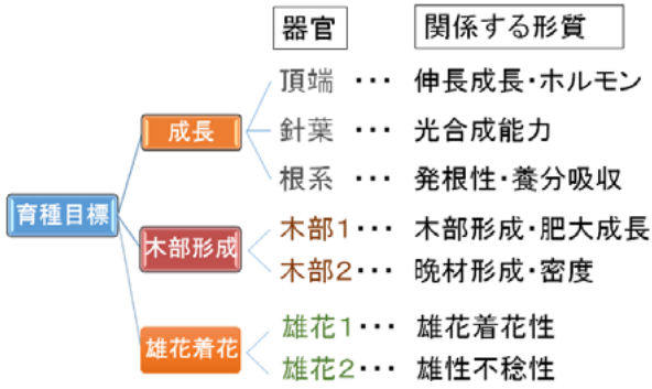
図1 EST情報を収集した器官とそれらの器官が関係する形質