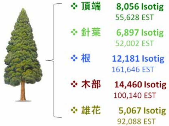
図2 収集した器官別のEST数とそれらを統合したIsotig数