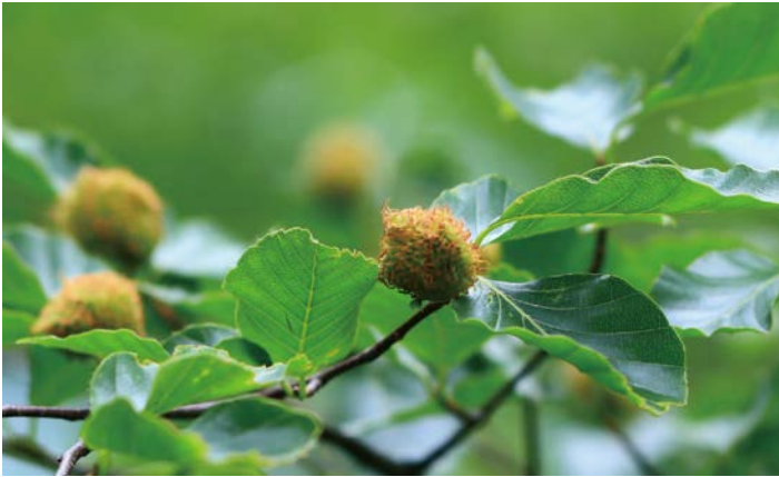
図1 ブナの殻斗（どんぐりの全体を包んでいる包状器官）。この中に種子が2個あり、殻斗や葉から窒素をもらいながら成熟していく