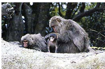
写真 調査を行った屋久島の照葉樹林帯に生息するニホンサル。20～30頭程度の個体からなる群れで生活し、頻繁に声でコミュニケーションをとっている。