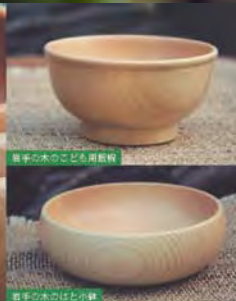
岩手の木のこども用お粉