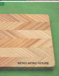
矢羽印のコースター