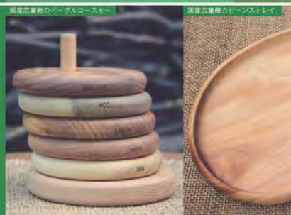
風車広葉樹のベークルコースター

磐梯山の南西。雪深い山間の南会津町。四季折々の山の姿は厳しくもあり、美しくもあり。とても表情豊かです。ブナ、ケヤキ、トナリといった、山を彩る木をお手元でお楽しみください。