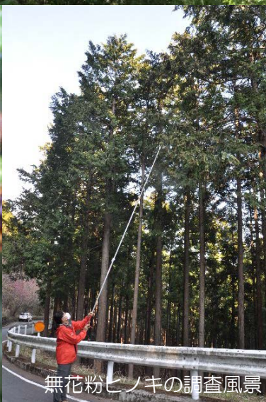
無花粉ヒノキの調査風景