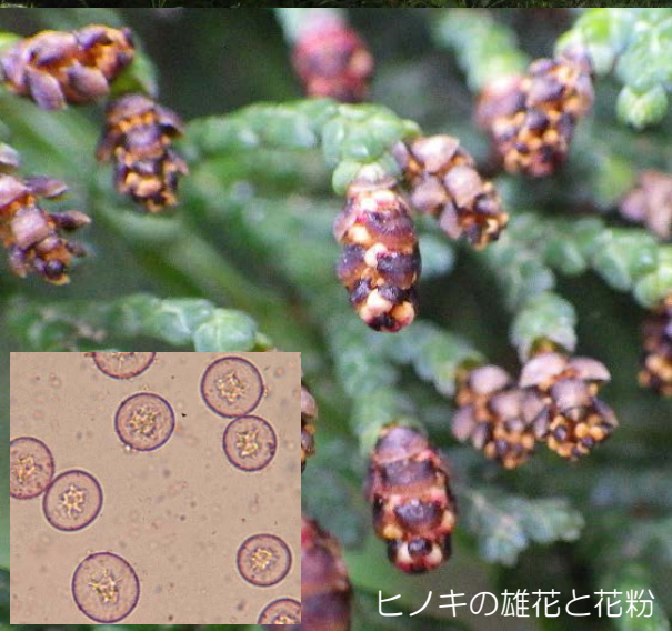
ヒノキの雄花と花粉