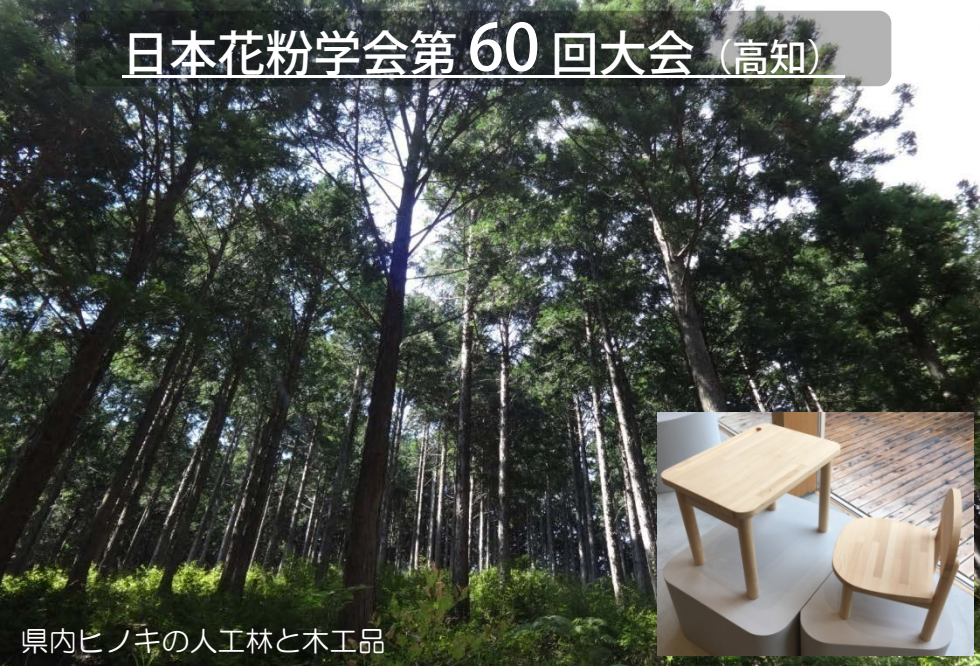
県内ヒノキの人工林と木工品