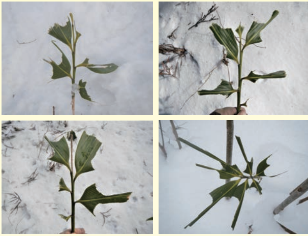
写真2 シカに食べられたクマイザサ

nippongene.com/kensa/products/lamp-kit/sika/sika-kamosika.html) (Aikawa et al. 2015; 相川ら 2018)。このキットを活用すれば、ササを含むあらゆる植物に付いた食痕、そしてその周辺に落ちている糞などから、その場にいた動物種(シカまたはカモシカ)を特定することができます。