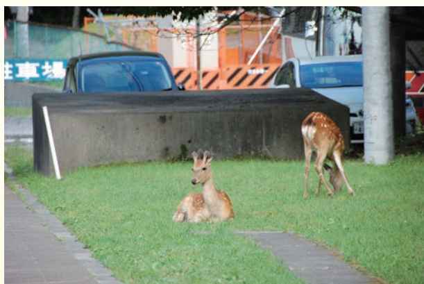
写真1 増えすぎて町中にも出没するようになったニホンジカ(岩手県釜石市)

ニホンジカ(シカ)(写真1)は日本を代表する大型野生動物です。このシカが、今、日本全国で急激に増えています。統計資料によると、1980年代に約30万頭だった本州以南のシカの頭数は、2016年にはその10倍近い約270万頭にまで達したとされており、日本各地で農業被害や林業被害を引き起こしています。東北地方も例外ではなく、1970年代には岩手県と宮城県の一部にしか生息していませんでしたが、2000年頃から急激な増加に転じ、今では秋田県や青森県な