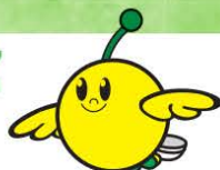
福島県復興シンボル キャラクター キビタン