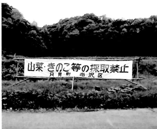
図4 採取禁止区域を示す案内(広範囲の入山料制では、採取禁止区域の掲示が必要になる)