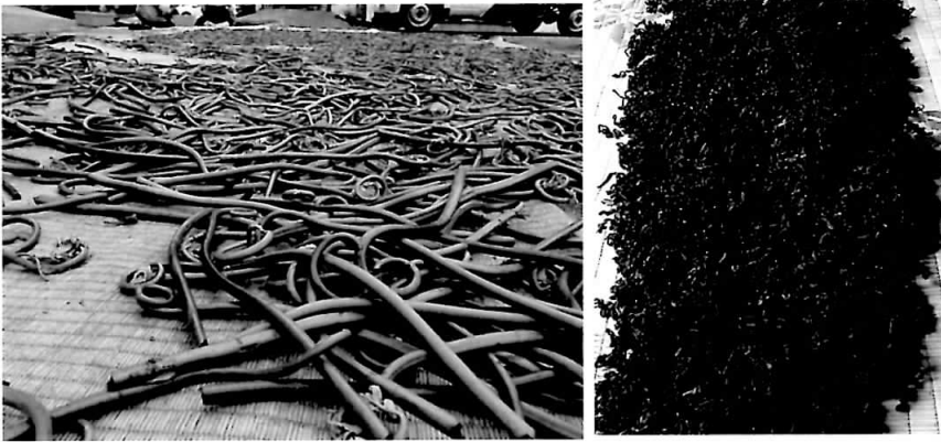
図2 乾燥初期（左）と乾燥後（右）のゼンマイ

持に結び付いていました。しかし、その資源の利用者の減少とともに資源が劣化し、資源を供給する能力のある土地が豊富に存在していても、残された利用者あるいは別の潜在的な利用者には利用できなくなってしまう。こうした状況はしばしば過少利用状況と呼ばれます。