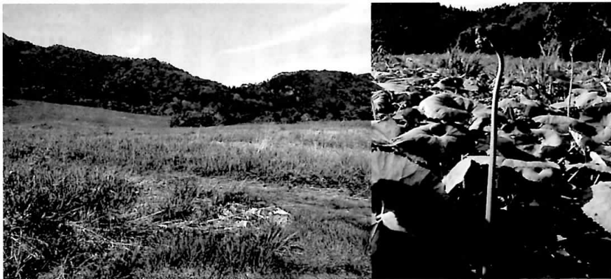
図3 わらび園（左）とわらび（右）

では、過少利用状況にある入会林野をうまく管理するためには、何が必要でしょうか。筆者は福島県会津地方で、ゼンマイ採取を中心として古くから行われていた山菜・キノコ利用について研究しました(図2)。会津地方では山菜・キノコ利用については基本的に共有林として集落が利用や管理のための意思決定を行っていました。調査を行った10集落の共有林のうち、5集落で部外者入山制が行われていました。そのなかには、わらび園などのように比較的狭い地理的範囲で入山料をとるものや(図3)、広域の山林で入山料をとるもの(図4)がありました。入山料制が実施されている集落には毎年数十万円〜数百万円の入山料収入が得られ、その利益は共有地の管理等に使用されていました。 過少利用問題に関してこの研究から得られた解決策の一つは、従来の資源の利用者だけでなく、部外者にも利用してもらおう、というものです。ただし、単に部外者に対して資源を開放してしまえば、資源が劣化してしまう可能性もあります。そこで、