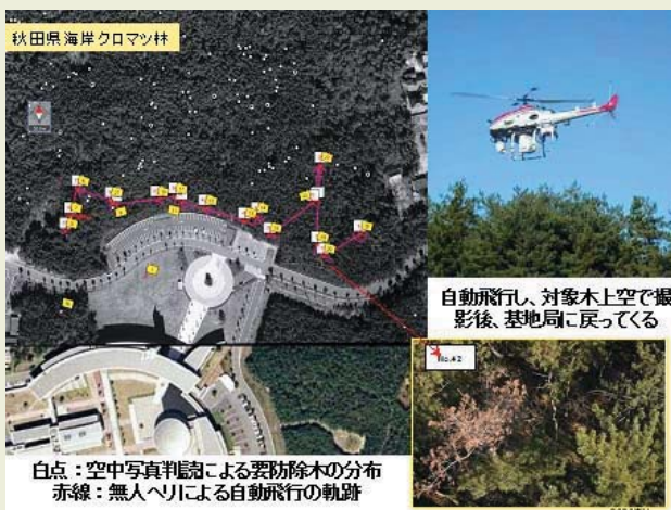
写真2 精密オルソ画像から判読した位置情報で無人飛行するヘリ （秋田県立大周辺）

そこで、最適な時期に上空から航空写真を撮影し、最新の技術で精密な画像（精密オルソ画像）を作成します（写真1）。これにより一本一本の樹木が手に取るように把握でき、しかも位置がほぼ40cmの誤差で計測できます。これを判読することによって、どこに、どれだけの要防除木があるのかが一目瞭然になるのです。この方法を用いれば現地での予備調査も不要になり、すぐに見積もることも可能となるでしょう。現場で作業する人も、この情報を使って林内で迷うことなくすみやかに要防除