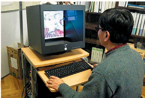
写真1 最新の三次元立体計測装置

実は、空を飛ばす軽飛行機（セスナ）から連続して写真を撮影します。この連続する空中写真の2枚を立体視し、機械的に画像を計測し地表面の高さを求めているのです。