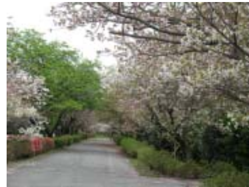
静岡県 国立遺伝学研究所