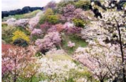
東京都 多摩森林科学園