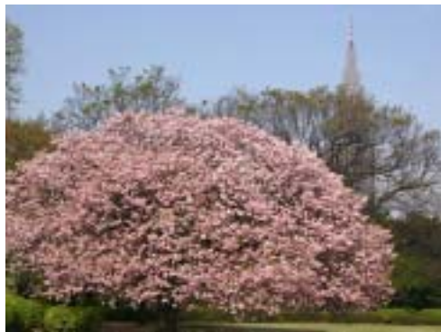
東京都 新宿御苑 64個体