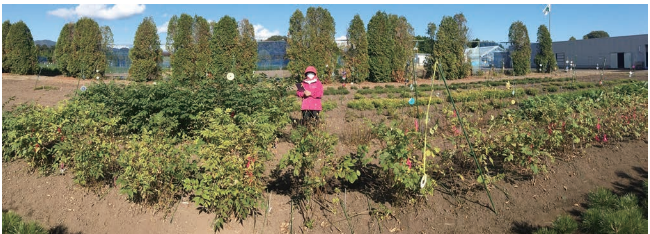
図1 苗畑で育苗中のキハダ実生