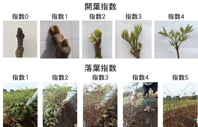
図2 キハダの開葉・落葉指数の目安