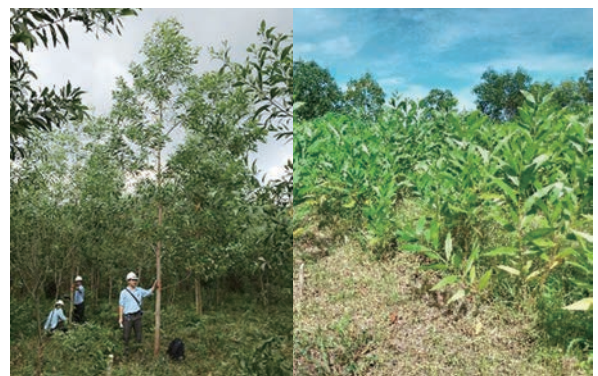
写真左：選抜した優良個体 写真右：植栽後約半年の採穂台木

品種開発に着手して15年足らずで新品種が事業的に植栽され20年以内に収穫されるということは、日本の林業関係者としては脅威に感じられる一方、林産業の視点からは、国内の木材需要を賄うために微力ながら貢献できているとも考えています。