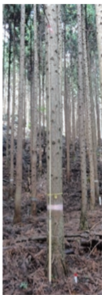
図-1 初期成長に優れた第2世代品種(F) スギ林育2-31

令和4年度は、東北育種基本区で4品種、関西育種基本区で7品種のマツノザイセンチュウ抵抗性アカマツ品種を開発しました(表-3)。このうち、関西育種基本区で開発した7品種は、抵抗性品種同士の交配苗木から開発した第2世代品種となっています。また、東北育種基本区で4品種、関東育種基本区で3品種、九州育種基本区で7品種のマツノザイセンチュウ抵抗性クロマツ品種を開発しました(表-4)。このうち、「千葉(成東)クロマツ14号」は千葉県と林木育種センターの共同開発品種となっています。