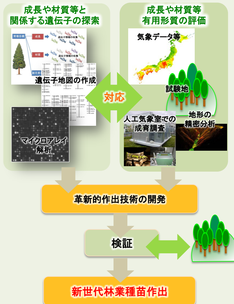
図1 短期間で新系統を選抜する技術開発の流れ

高い性能を有した新系統を早期に普及することが求められており、採種園や採穂園に新系統を迅速に導入する必要があります。このことから、選抜した新系統を早期に増殖するため促成クローン増殖技術の開発にも取り組みました。