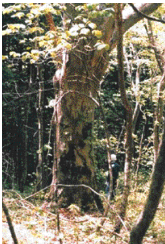
写真 - 1 青森ケヤキ18林木遺伝資源保存林