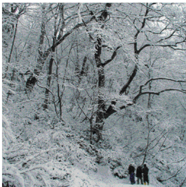
写真 - 3 前橋ミズナラ・ケヤキ20林木遺伝資源保存林