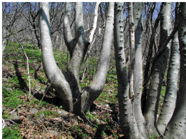
写真 - 2 秋田ケヤキ9林木遺伝資源保存林