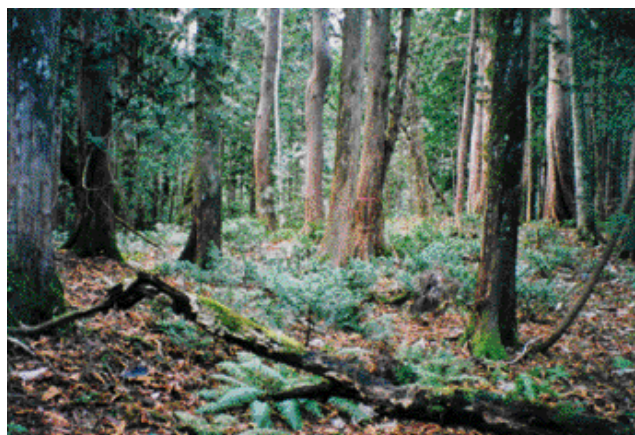
写真 - 2 林床に生えるヒバ稚樹