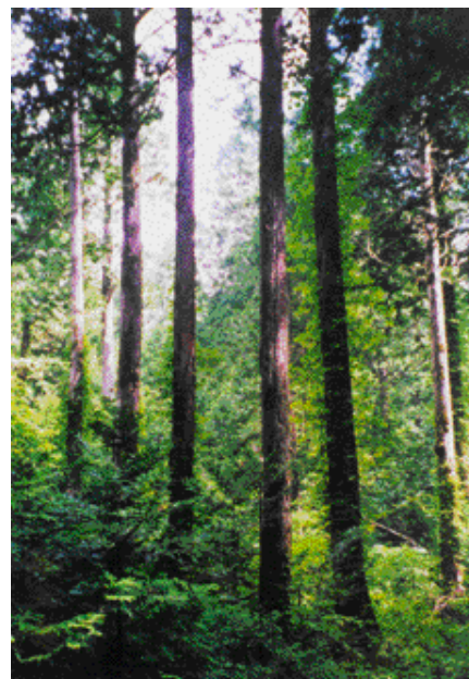
写真-1 青森県大畑のヒバ林