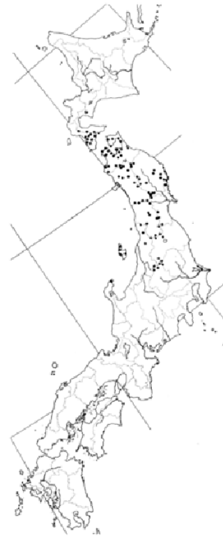
図-1 ヒバの天然分布(倉田 3) から転載)

青森県大畑町にある大畑施業実験林内の参考林で調査を行いました。大畑施業実験林は松川恭佐氏が提唱した「森林構成群を基礎とするヒバ天然林の施業法」の実験のため1931年に設定された実験林で、参考林はその中に対照として設定された保存区です 1) 。保存区は、設定以降、施業が行われていないので、人為の影響の少ない林分であり、かつ、下北半島のヒバ林の林相を代表する場所であることから調査地としました。