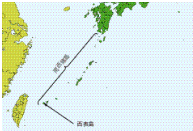
図-1 南西諸島および西表島の位置