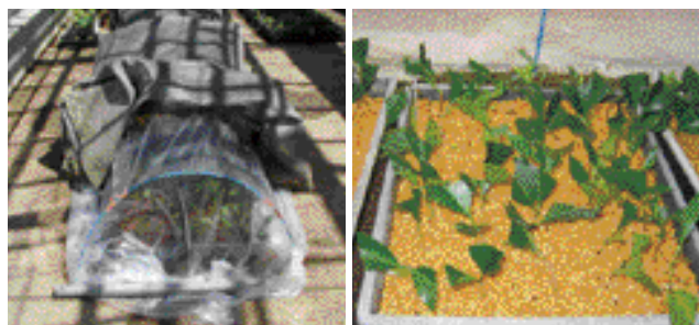
写真-1 密閉によるさし木

樹木を増殖させるには様々な方法がありますが、まずさし木による増殖に取り組みました。さし木は、同一遺伝子を持ったクローンを比較的容易に増殖させることができる方法です。さし木は毎年6月に密閉さし(写真-1、2)などの方法で実施し、10~11月に発根率の調査を行いました。いずれの樹種でも2母樹以上から採穂を行い、母樹別に試験を実施しました。さし木増殖が可能とした樹種は、平均発根率が10%以上を示した樹種としました。