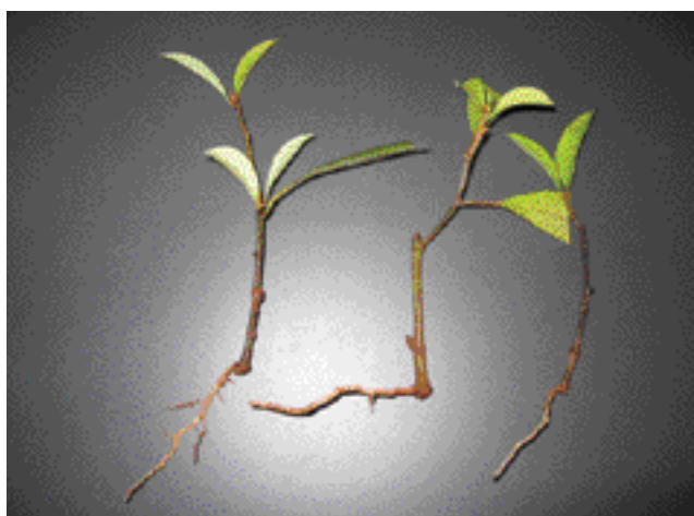
写真 - 4 発根が確認されたタイワンオガタマノキ

は、オガタマノキの変種とされ、日本では石垣島以南に生育していますが、これらの地域では用具材として重要な樹種となっています。この樹種は、種子の結実期に台風がよく襲来することによって種子の収集が困難となっており、これまで当センターでさし木試験を進めてきました。最初は、ガラス室やインキュベーター（恒温器）内などでさし木を行ってききましたが、MCPBと呼ばれるオーキシ系植物成長剤を試験的に散布したところ、多くの個体で発根が認められました（写真 - 4）。まだ発根した根の数が少ないなど問題があることから、今後はさらに発根率を高くし、発根数を多くすることを目的として、様々な発根促進剤を利用してさし木試験を実施する予定です。また、その他のさし木が困難な樹種への様々な発根促進剤の適用も検討しています。