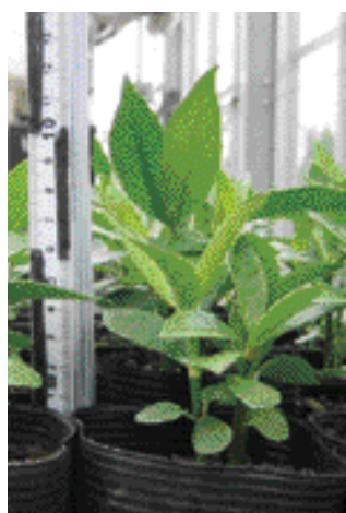
写真 - 5 発芽したボチョウジ

種子による増殖可能な樹種の樹種別の発芽率を表 - 2 に示します。増殖が可能となった樹種は、これまでに試験をした32樹種のうち14樹種となっています。ショウベンノキやボチョウジ（写真 - 5）などで高い発芽率を示しました。一方で、アワダンやアデクなどはほとんど発芽がみられませんでした。また、オキナ