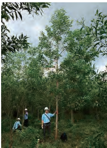
写真4 【アカシア属人工交配の実証試験】優良個体の選抜