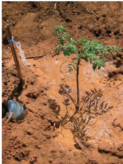
写真2 【ケニアのJICA技術協力プロジェクト】採種園へのメリア苗木の植栽