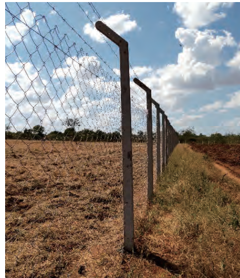
写真3 【ケニアのJICA技術協力プロジェクト】採種園周囲へのフェンスの設置