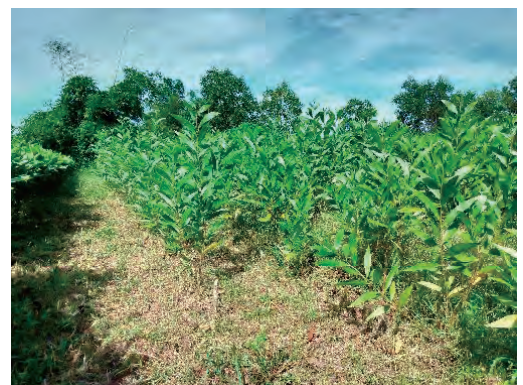
写真6 【アカシア属人工交配の実証試験】共同研究で開発した優良候補クローンの採穂園