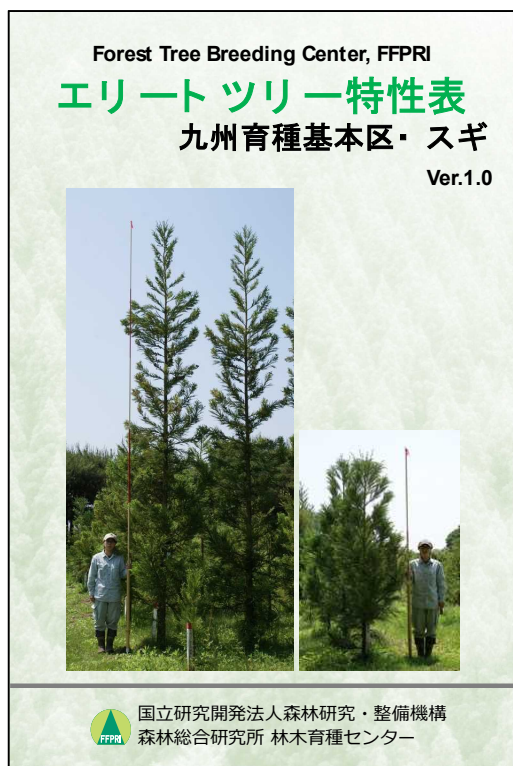
図1 エリートツリー特性表の表紙