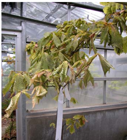
病原菌接種により萎れはじめたミズナラ