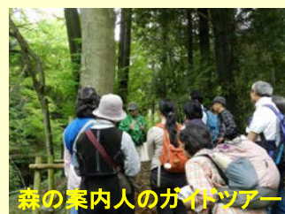
森の案内人のガイドツアー