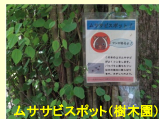
ムササビスポット（樹木園）