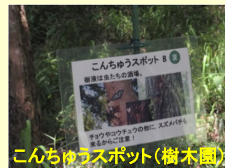
こんちゅうスポット（樹木園）